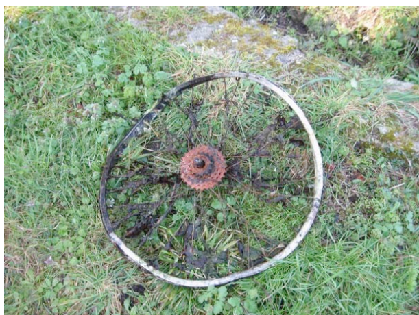
On trouve de tout...

Un soleil radieux annonçait une belle journée, propice aux activités projetées. Le groupe s'est rapidement divisé en plusieurs équipes qui se sont dirigées vers différents lieux où des dépôts illégaux de détritrus avaient été remarqués. Le groupe des enfants et leurs accompagnants se sont attaqués au secteur des Allées, aux alentours de la Mairie, du cimetière et du tennis, puis ils se sont rendus vers la ligne SNCF désaffectée et les fossés de la D9 en direction de Neuville. Un autre groupe est parti nettoyer les abords de l'ancienne décharge municipale.