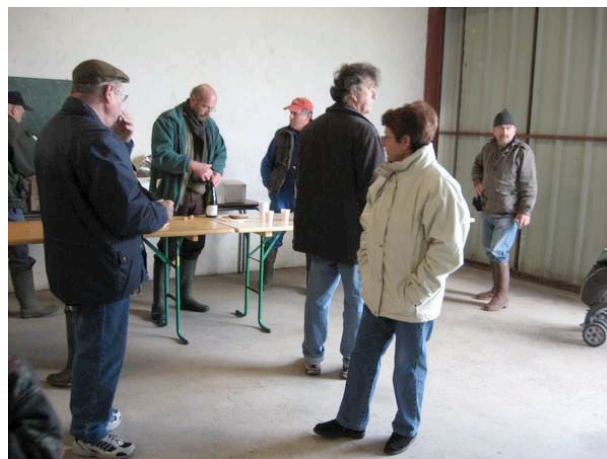
...vers un vin d'honneur bien mérité

Fatigués mais heureux de leur travail, les participants se sont retrouvés au hangar communal pour partager un vin d'honneur bien mérité. Tous ont été impressionnés par le volume des objets ramassés et par leur diversité. Tous ont été fiers de ce qu'ils ont fait pour la collectivité et se sont engagés à recommencer l'an prochain. Un grand merci à tous les participants, spécialement aux enfants qui ont participé à cette opération.