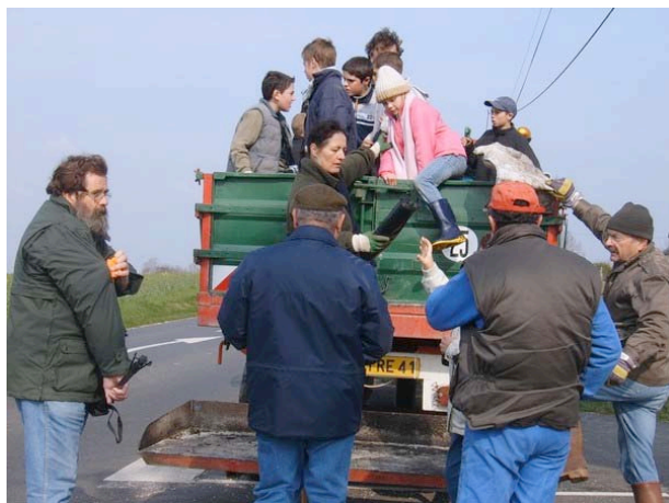
Un nouveau transport en commun...

ramassés, remplissant les deux remorques communales. La diversité et la quantité des déchets retrouvés restent incompréhensibles, sachant que tout est fait pour en assurer la collecte dans de bonnes conditions (ramassage à domicile, déchèteries,...). Ceci d'autant plus que le prix à payer pour la collecte, le recyclage ou la destruction des déchets ne varie pas en fonction des quantités rejetées. Imaginez ce qui se passerait si nous devions payer le ramassage au poids, combien de poubelles retrouverait-on dans les fossés ?