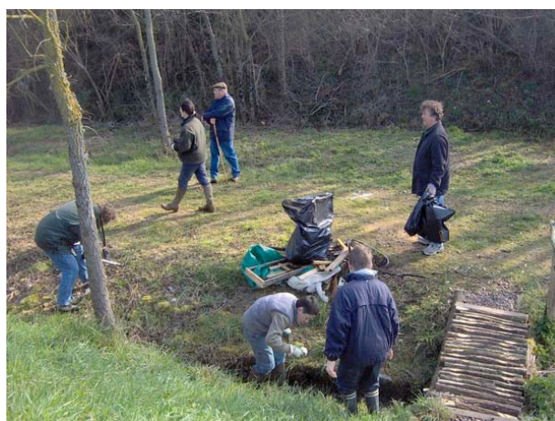
...et en avant pour le grand nettoyage !

Un soleil radieux annonçait une belle journée, propice aux activités projetées. Le groupe s'est rapidement divisé en plusieurs équipes qui se sont dirigées vers différents lieux où des dépôts illégaux de détritrus avaient été remarqués. Le groupe des enfants et leurs accompagnants se sont attaqués au secteur des Allées, aux alentours de la Mairie, du cimetière et du tennis, puis ils se sont rendus vers la ligne SNCF désaffectée et les fossés de la D9 en direction de Neuville. Un autre groupe est parti nettoyer les abords de l'ancienne décharge municipale.